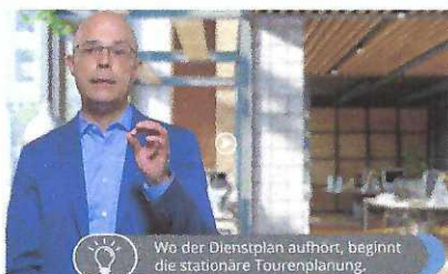
E-Learning Pflegecampus zu Stationäre Tourenplanung

Die Durchführung des Seminars setzt sich aus Vortragsanteilen und Gruppenarbeiten zusammen.