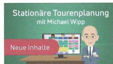
E-Learning Smart aware zu Stationäre Tourenplanung